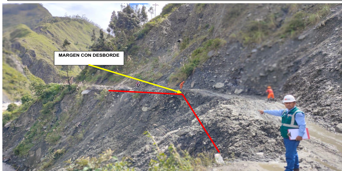
FIGURA N° 02: SOCAVAMIENTO DE CARRETERA QUE VA AL DISTRITO DE ALTO INAMBARI Y DISTRITO DE YANAHUAYA.