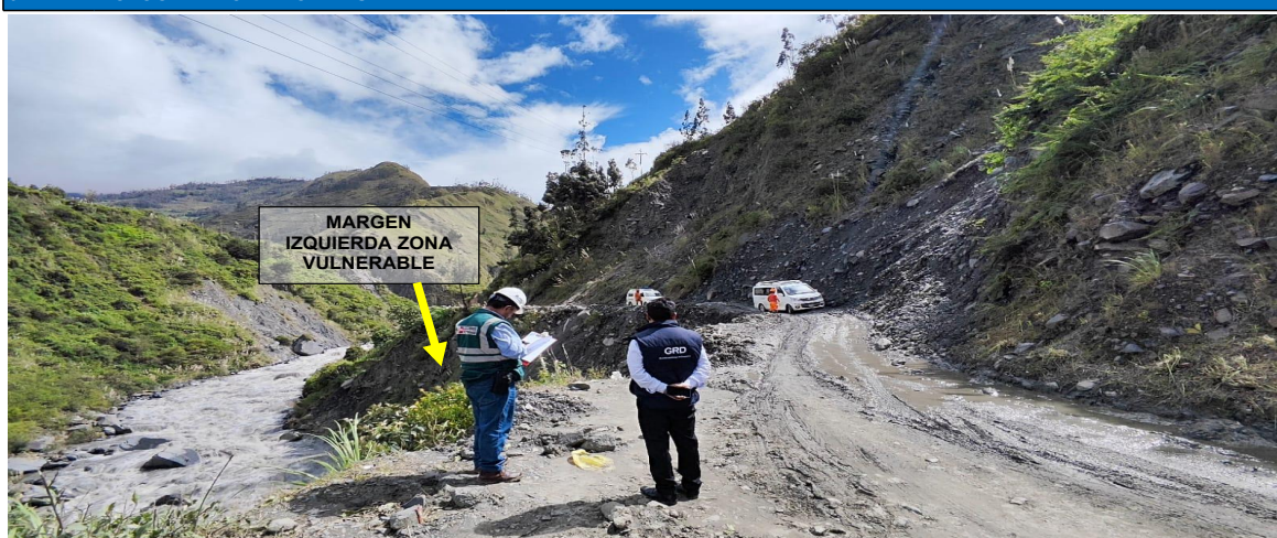
FIGURA N° 01: SOCAVAMIENTO DE CARRETERA QUE VA AL DISTRITO DE ALTO INAMBARI Y DISTRITO DE YANAHUAYA.